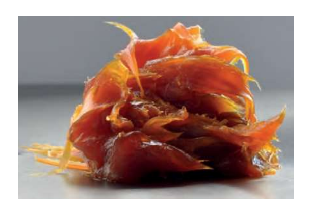
Fig. 2. Crude ovo-phospholipid Rys. 2. Surowy ovo-fosfolipid

Fosfolipidy wpływają na ogólne funkcje umysłowe dzięki obecności w ich składzie choliny, która jest także niezbędna do produkcji ważnego neuroprzekaźnika w postaci acetylocholiny. Jak wiadomo, substancja ta wpływa na funkcje mózgu, wzmacnia pamięć i koncentrację, pobu-